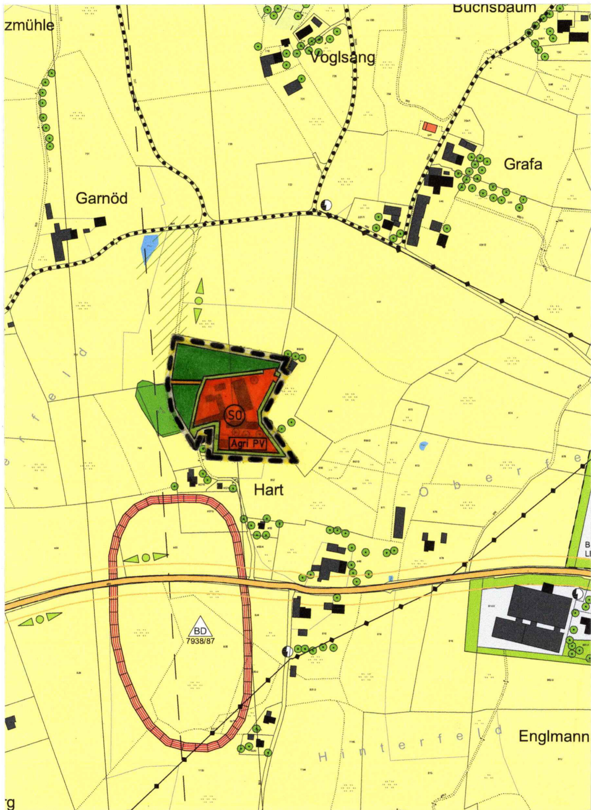
Änderung des Flächennutzungsplanes Pfaffing, Gemarkung Farrach