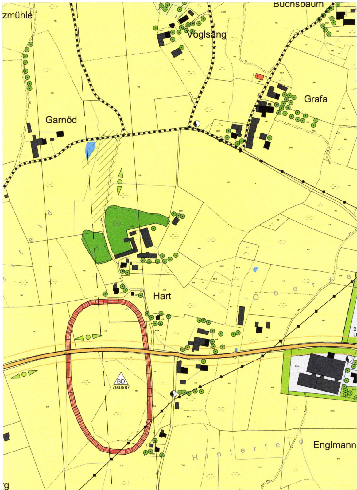
Auszug aus dem Flächennutzungsplan Pfaffing, Gemarkung Farrach